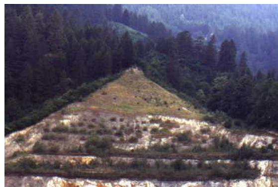
Foto 7 e 8: Miniera di Giustino, ante-operam e dopo 10 anni dagli interventi di rivegetazione