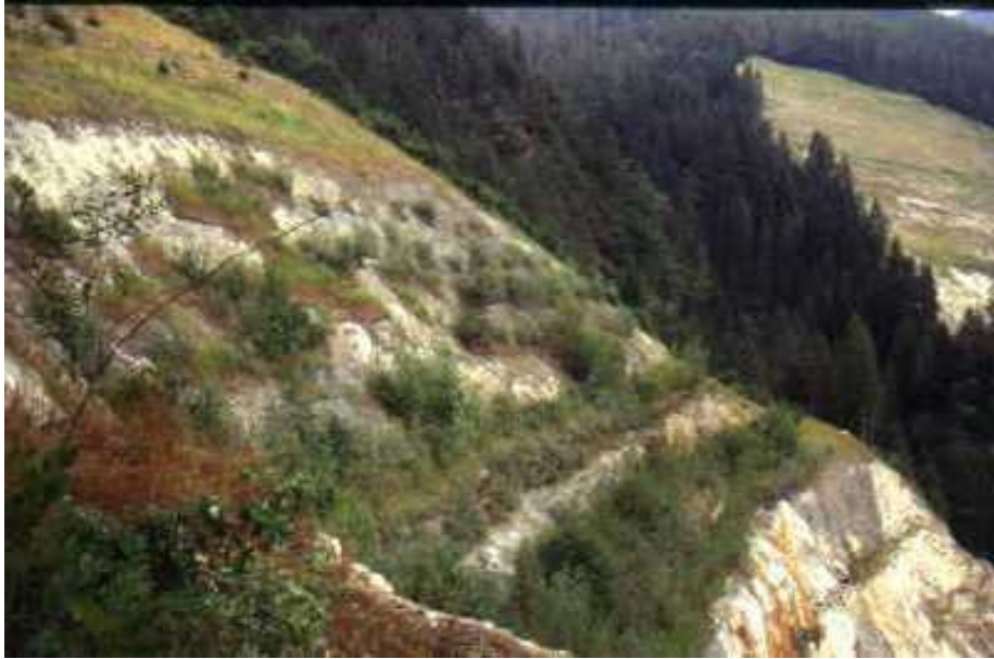
Foto 4: Miniera di Giustino, efficacia degli interventi di consolidamento e rivegetazione dopo 10 anni