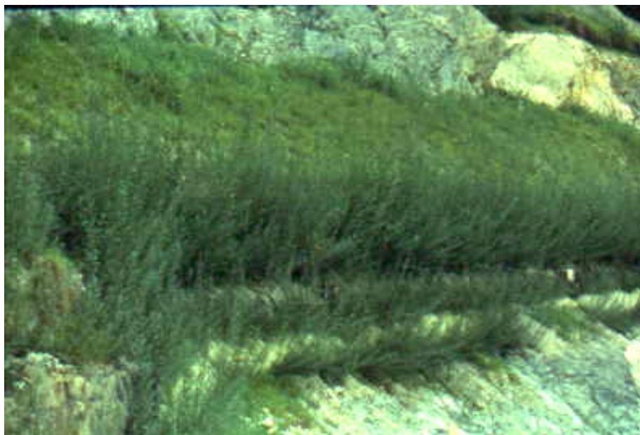
Foto 6: Terra rinforzata verde con talee di salice, miniera di Giustino