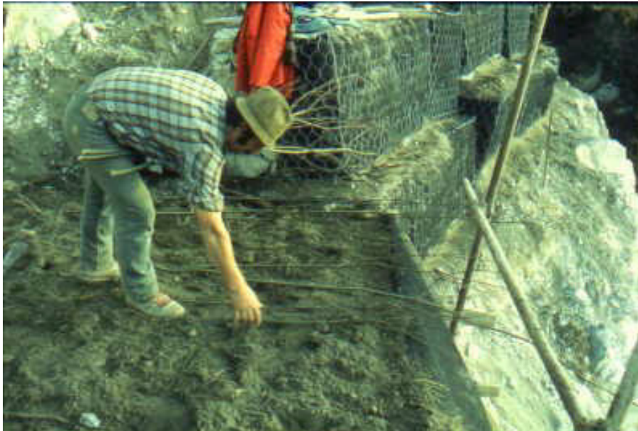
Foto 5: Rivegetazione e consolidamento al piede dei rilevati mediante gabbionate e terre rinforzate verdi su scavi e gradoni, Miniera di Giustino