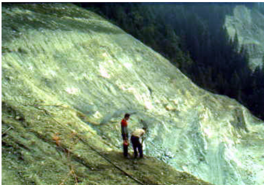
Foto 1: Miniera di Giustino, situazione ante-operam, 1986